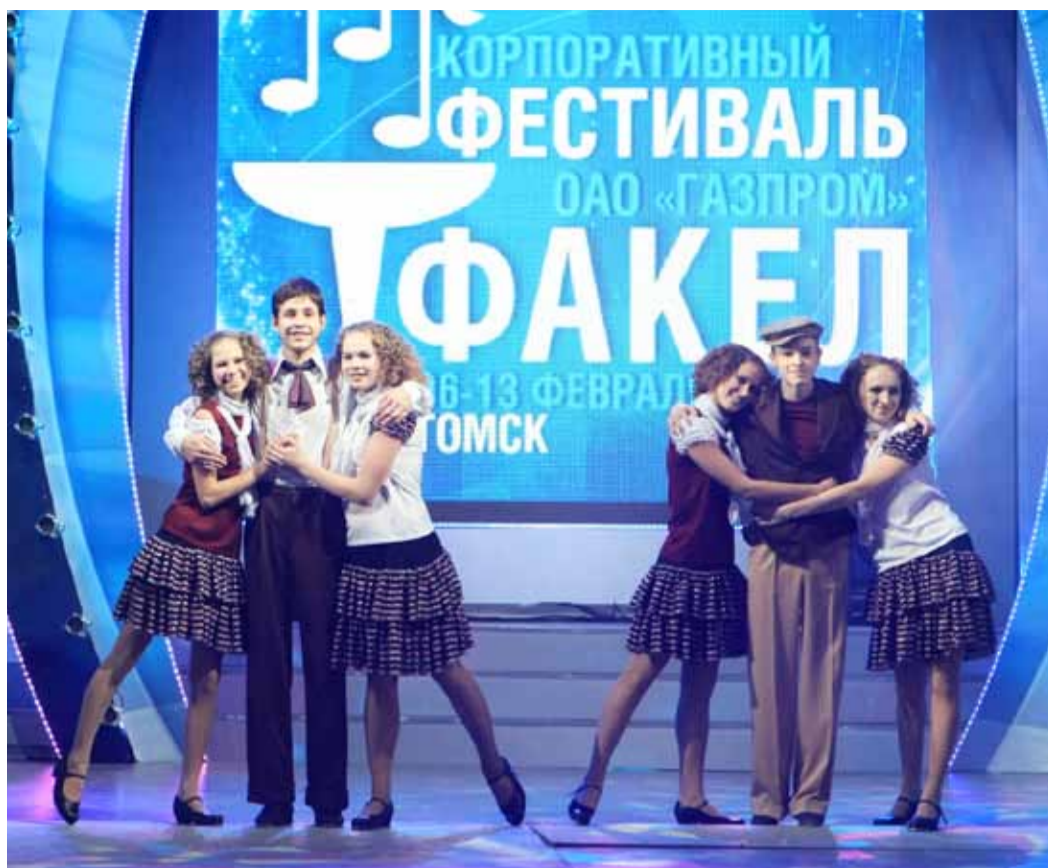
Сmen-группа «Step by step»

Но самыми уникальными талантами из всех представленных коллективов и солистов об-