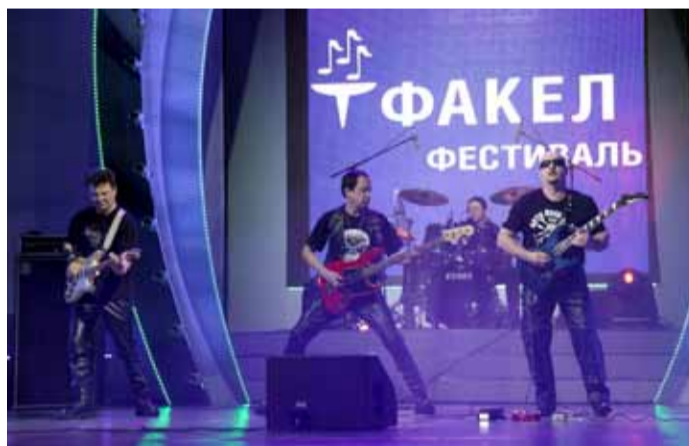
Группа «Джем», «Газпром трансгаз Югорск»