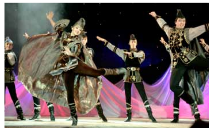
Народный ансамбль танца «Агидель»