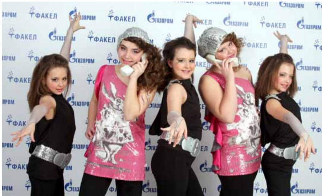
Команда «Газпром добыча Красноярск»: «От «Факела» ждем новых открытий, впечатлений, эмоций»