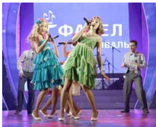
Вокальный ансамбль «New names», «Газпром трансгаз Екатеринбург»

Когда сидишь в зале, хочется проникнуть в мысли артистов, ожидающих своего выхода за кулисами. Что испытывают они в этот момент?