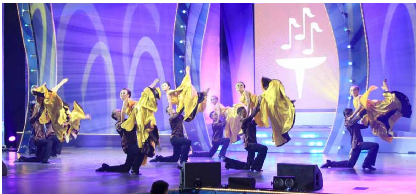
Ансамбль балетного танца «Фейерверк», «Газпром трансгаз Ухта»