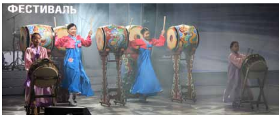
Инструментальный ансамбль «Гасан», «Газпром трансгаз Томск»